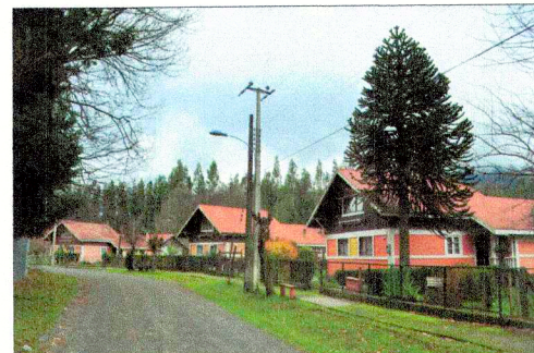
Fotografías de Villa García