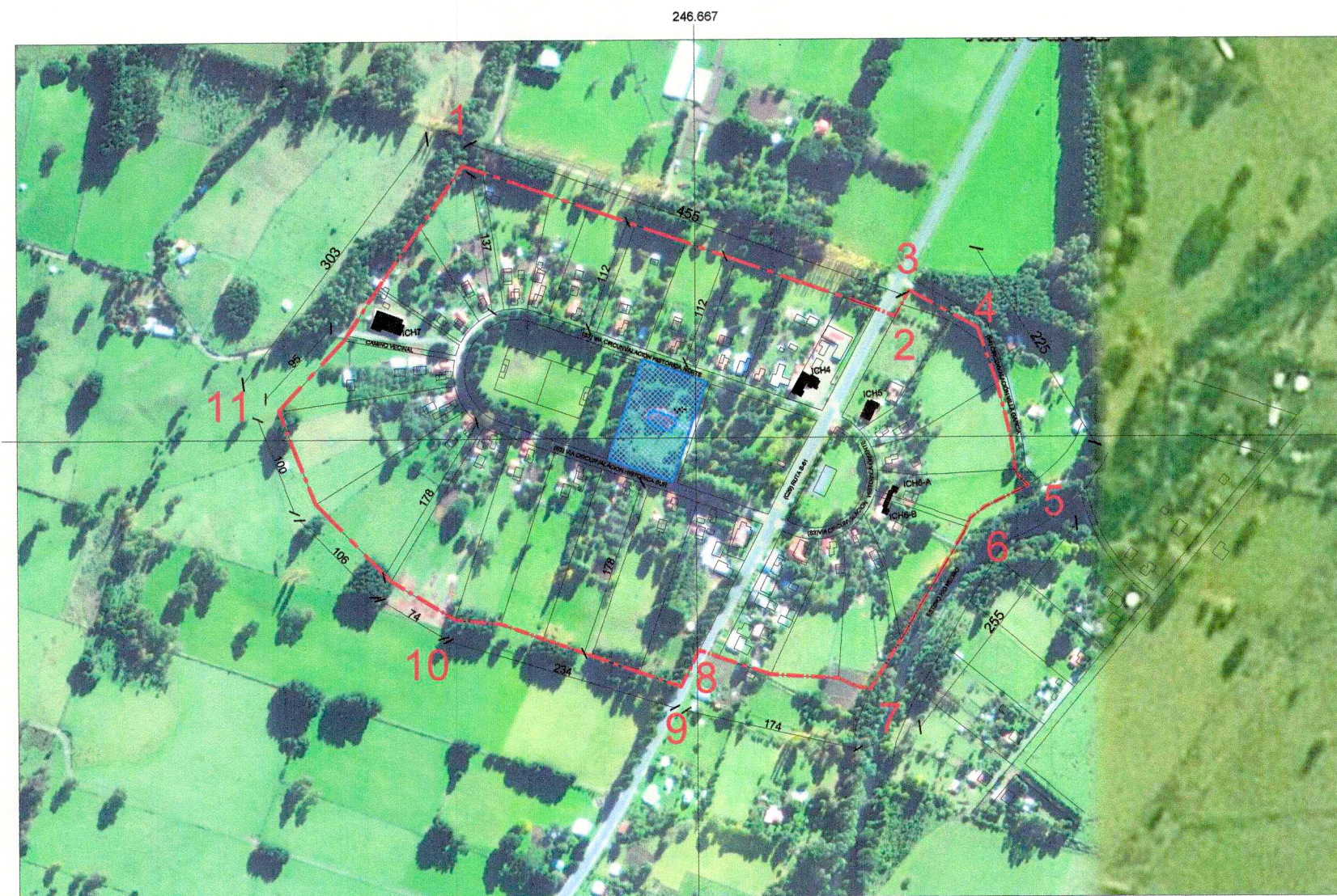
Lámina: 1 de 1 Fecha: 14-09-2017 Plano N°: 028-2017