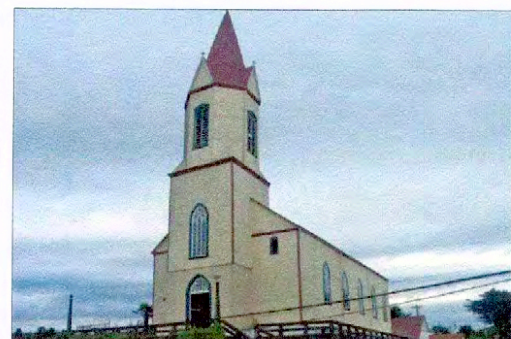
Parroquia San Agustín