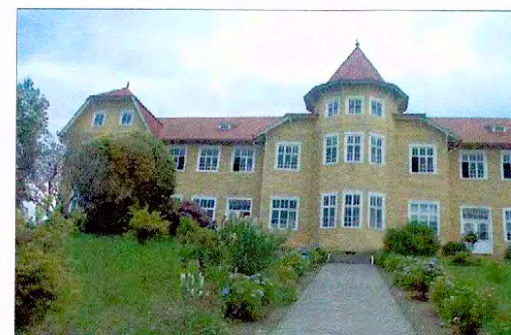
Colegio San Vicente de Paul