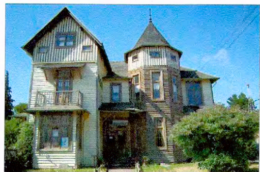
Casa Wulf N° 2