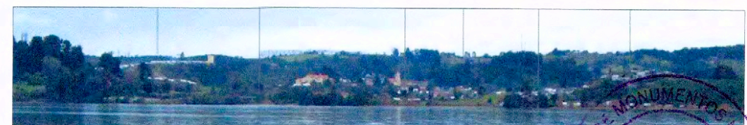
Vista Panorámica de Puerto Octay