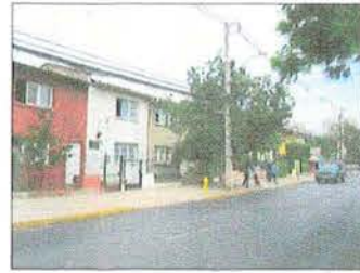
Población el Guanaco (1961) Mutual de Carabineros