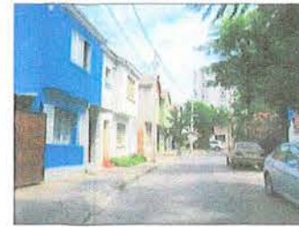
Población general Saavedra-calle Pintor Cicarelli (1943-1955) caja de previsión de empleados particulares. Sindicato de Zapateros