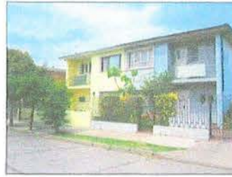
Población Las Rosas (1955-1959) Caja de empleados Particulares