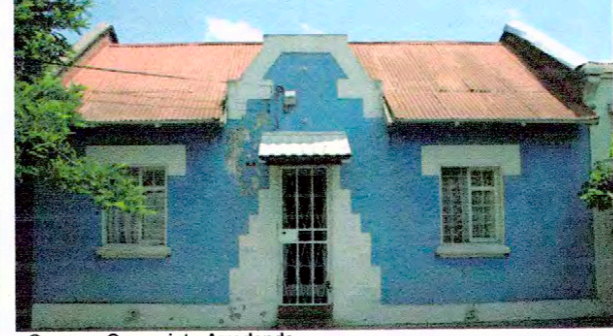
Casa en Conscripto Arredondo