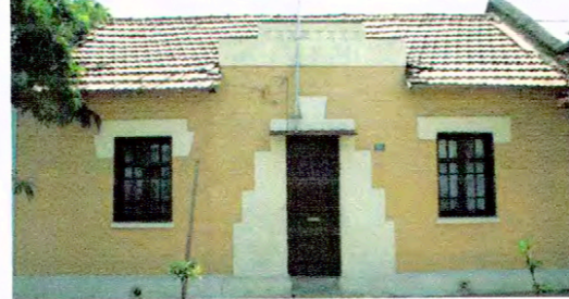
Casa en Sargento Luis Navarrete