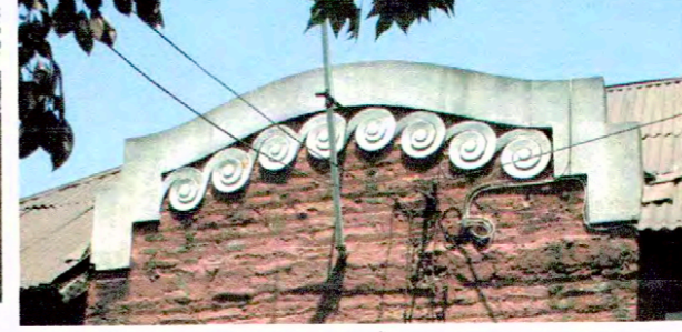
Volutas decorativas en muro antetecho