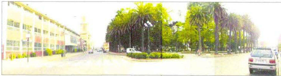
Vista general de Plaza de Curicó