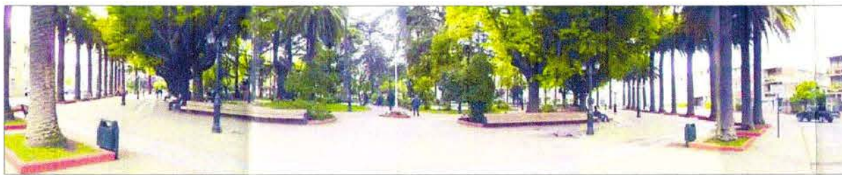
Vista general de Plaza de Curicó