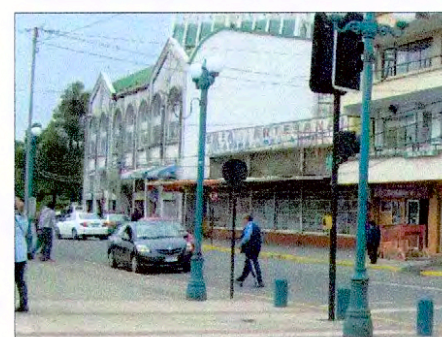
Edificios del Mercado Municipal y de la Feria Persa