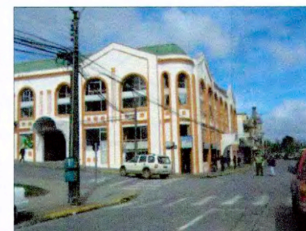
Edificio del Mercado Municipal