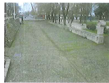
Vista del límite oriente