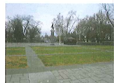
Vista general de la plaza