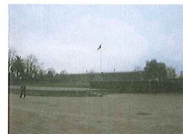
Vista de la plaza