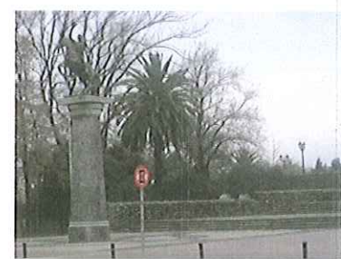
Vista del límite poniente