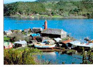
Vista de la iglesia desde el cerro