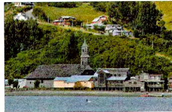
Vista de la iglesia desde el mar