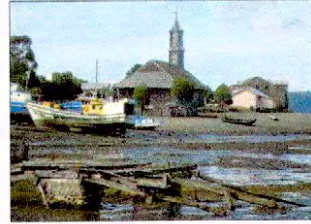
Vista de la iglesia desde el astillero