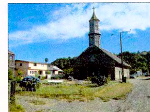
Vista de la fachada de la iglesia