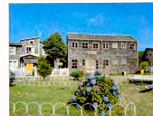
Vista inmuebles del entorno de la iglesia