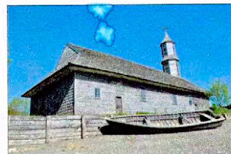
Vista lateral iglesia