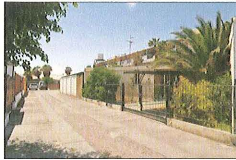
Calle Interior, sector de viviendas.