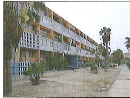
Fachada principal del edificio.