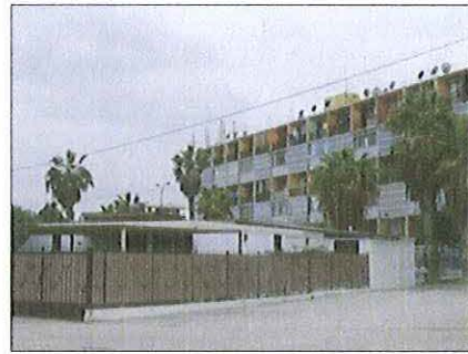
Vista de relación de viviendas con edificio.