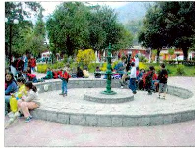
Vista Plaza de Armas