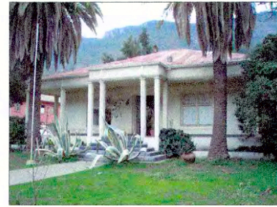
Casa Villa Comercio