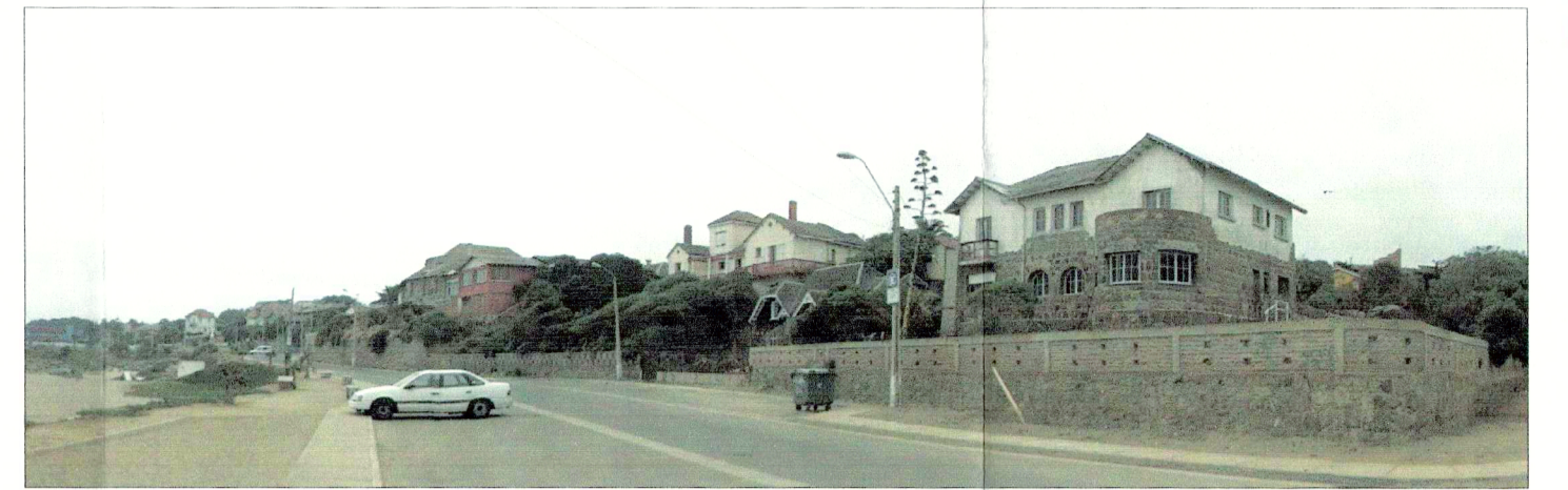
Vista Barrio Quirinal