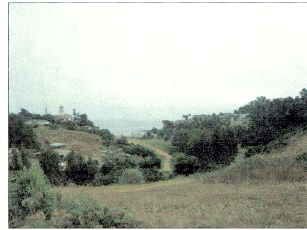
Vista quebrada La Hoyada