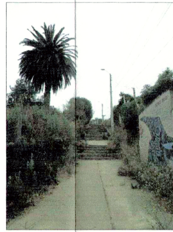
Escalera pública Barrio Vaticano