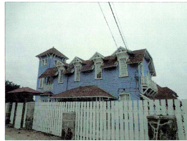
Casa sede de Fonasa (ex Sanatorio)