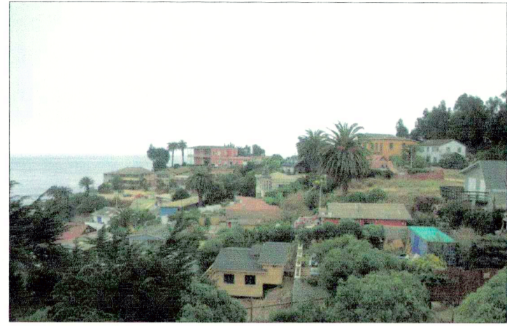
Vista del Barrio Vaticano hacia el poniente