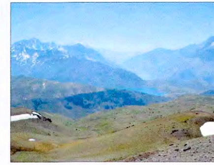
Vista hacia Embalse El Yeso