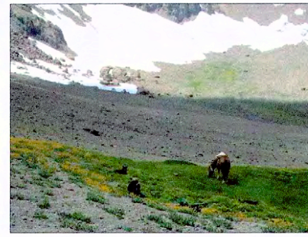
Pié del Cerro Piuquencillo