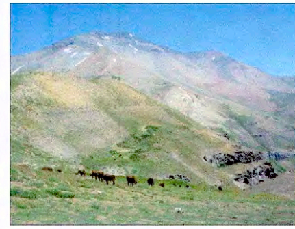
Límite entre predios