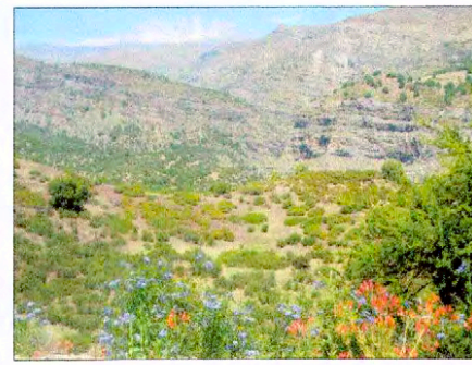
Paisaje vista sur