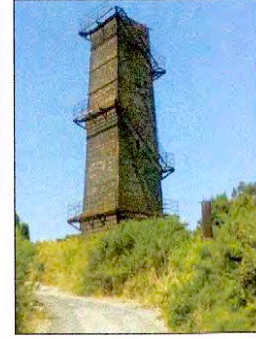
Vista actual, año 2010