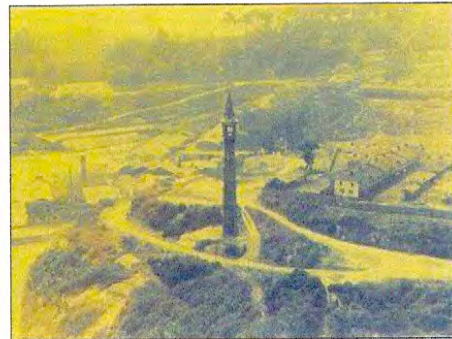
Vista año 1952