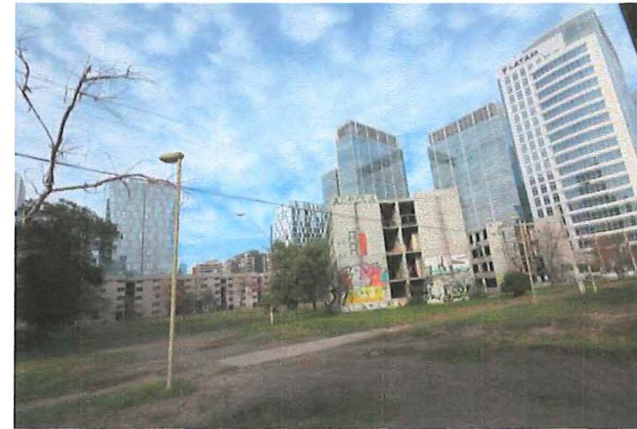
Vista de la Villa San Luis desde calle Presidente Riesco