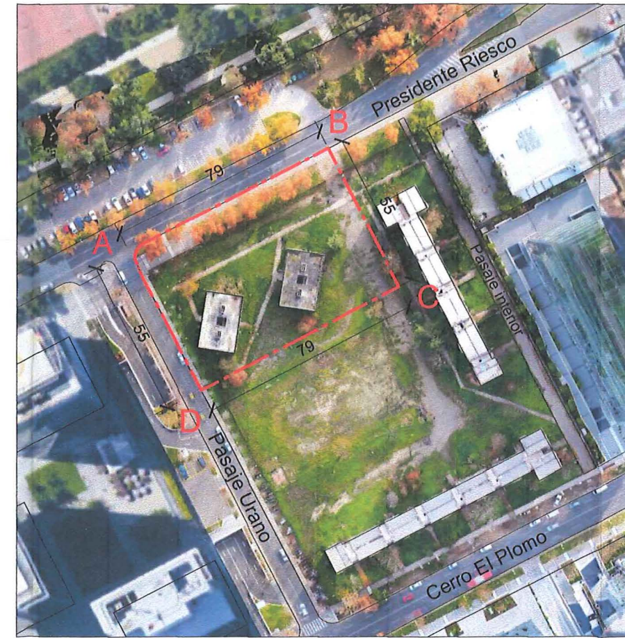
PLANO DE LÍMITES ESCALA GRÁFICA 0 20 40 60 80 m

Notas: Plano elaborado en el Consejo de Monumento Nacionales en base a: • Base Catastral I. Municipalidad de Las Condes, junio 2010. • Ortofoto CMN, Junio 2017. • Proceso de georreferenciación de acuerdo a la información desarrollada por el Área Territorio - CMN. Estándares: Datum WGS84, Huso 19 Sur. • Las cotas prevalecen por sobre el dibujo, son aproximadas y están expresadas en metros. En caso de fondos de predio, estos prevalecen por sobre la cota. • Esquicio de Chile: "Autoriza su circulación, por Resolución N°476 del 22 de octubre de 2014 de la Dirección Nacional de Fronteras y Límites del Estado". (*)Esta información no acredita propiedad