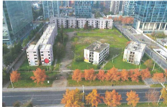
Vista panorámica de la Villa San Luis