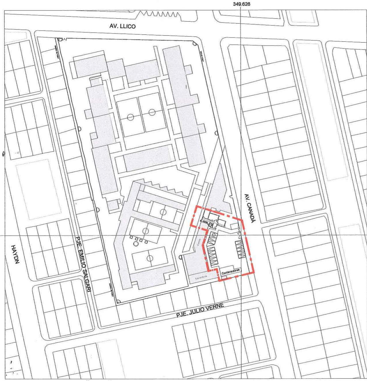
PLANO DE LÍMITES ESCALA GRÁFICA