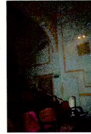
Vista interior del teatro