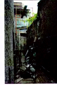
Vista de patio de servicio