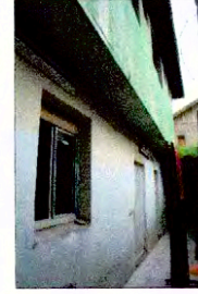
Vista de patio de servicio