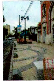
Vista de plazoleta