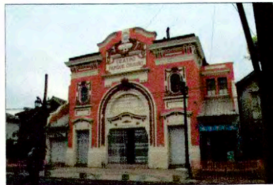
Fachada principal del Teatro