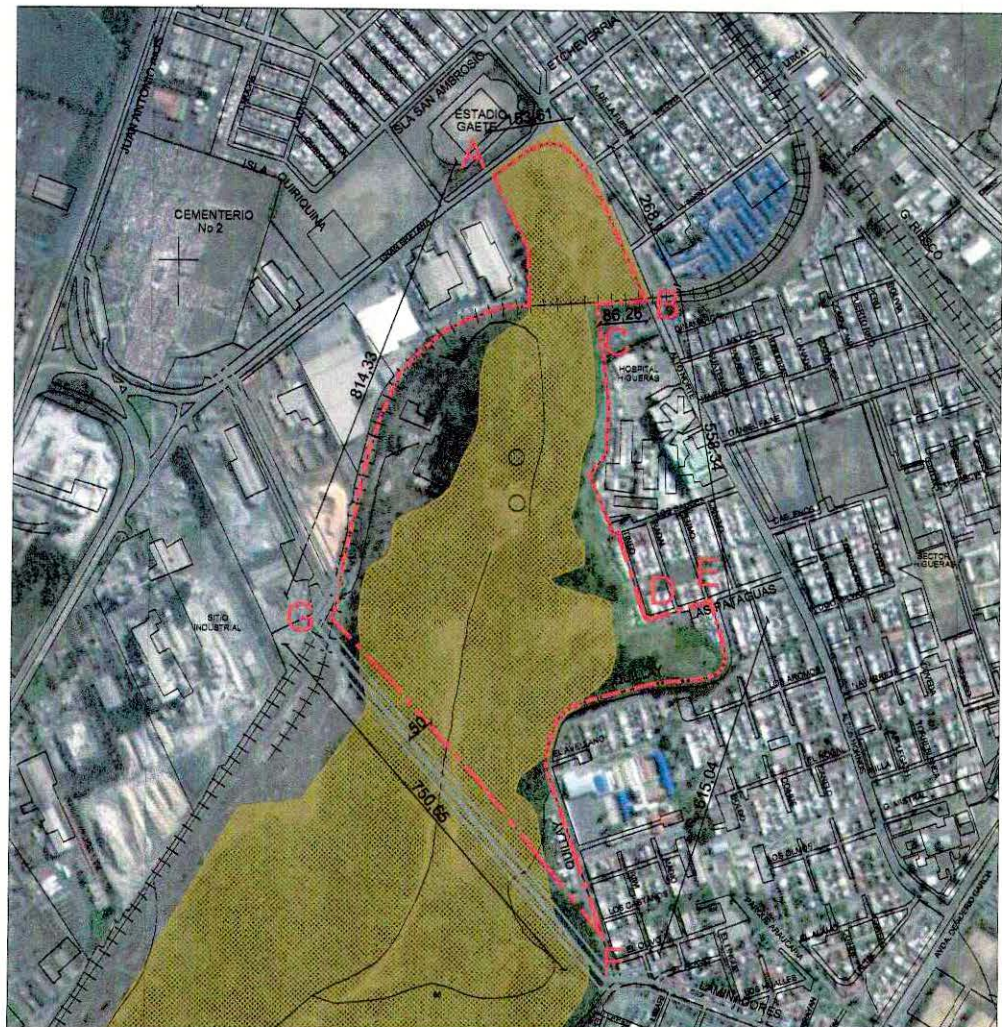
PLANO DE LÍMITES ESCALA GRÁFICA 0 200 400 600 800 m