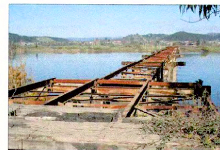
Vista del puente desde rívera norte del río