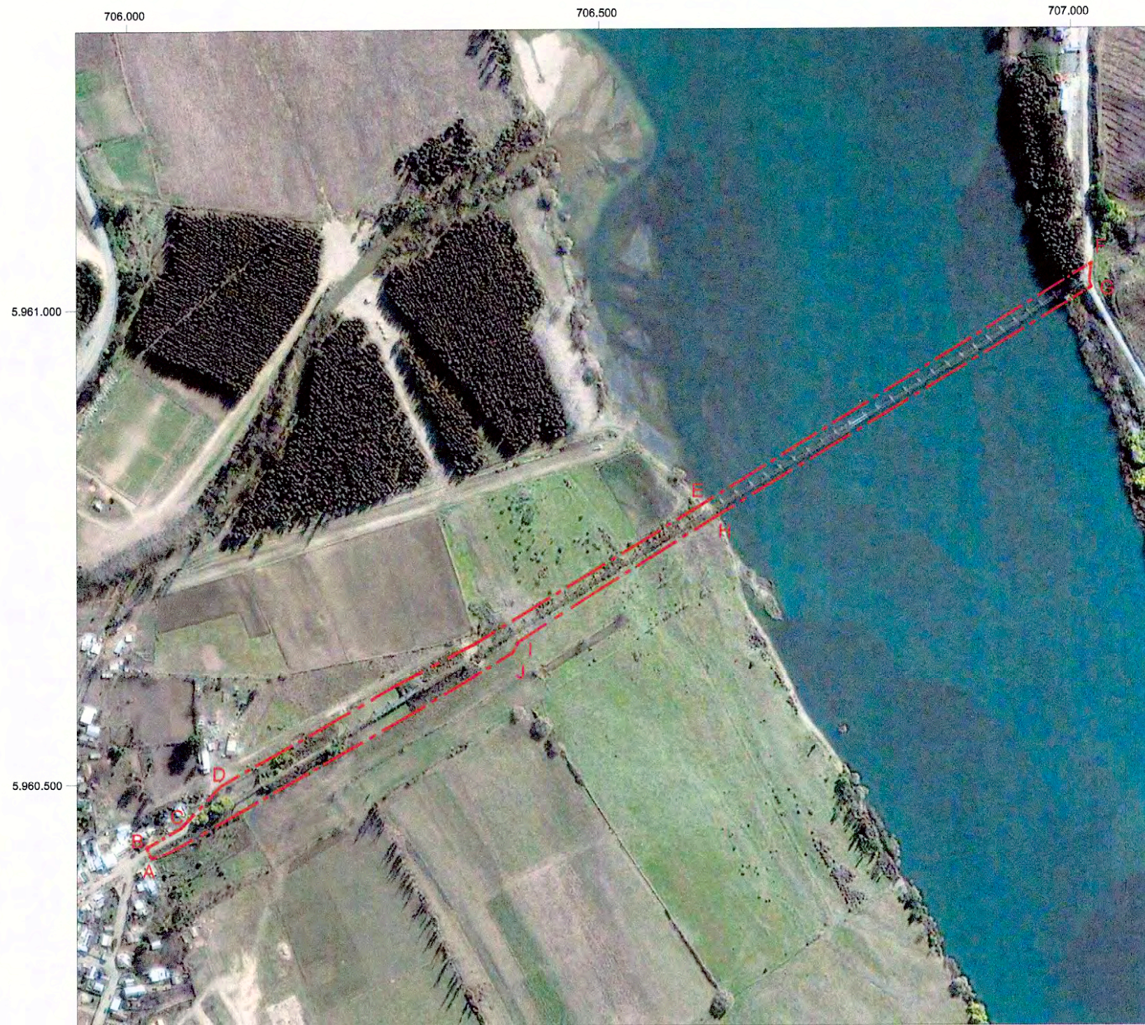
PLANO DE UBICACIÓN EN BASE A GLOBAL MAPPER SIN ESCALA