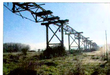
Vista parcial del puente