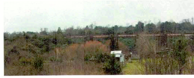
Fotografías del Puente Contra