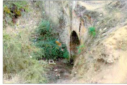
Fotografías del Puente Colonial en el canal San Carlos Viejo