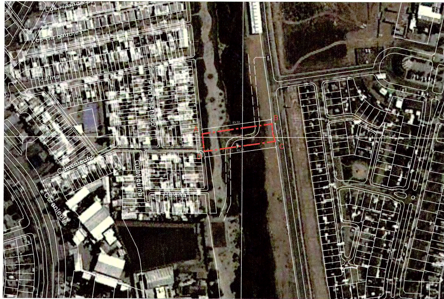
PLANO DE LÍMITES ESCALA GRÁFICA