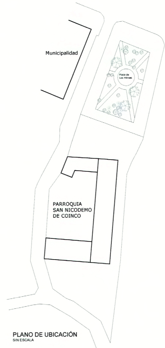
PLANO DE UBICACIÓN SIN ESCALA