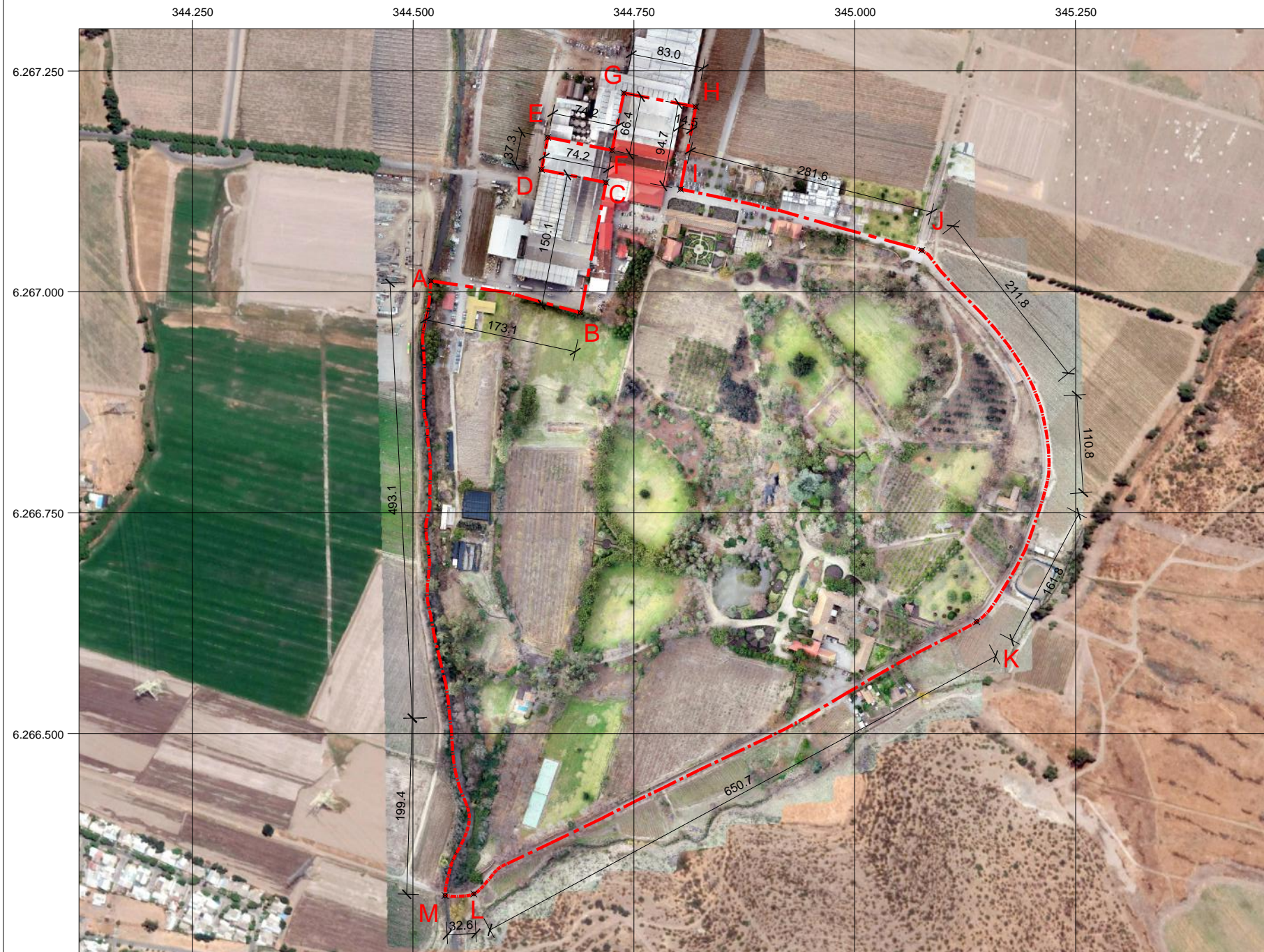
PLANO DE UBICACIÓN ESCALA GRÁFICA