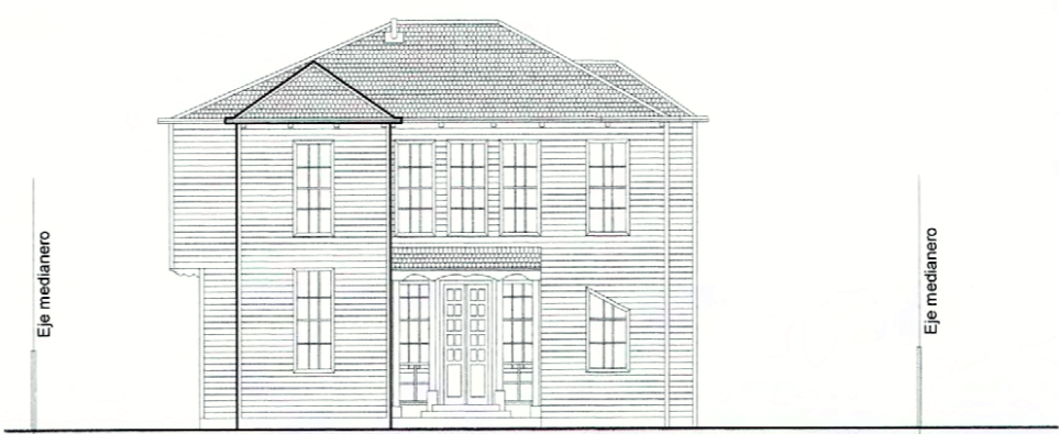
ELEVACIÓN FRONTAL ESCALA GRÁFICA