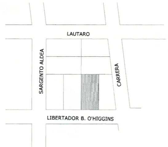
PLANO DE UBICACIÓN SIN ESCALA