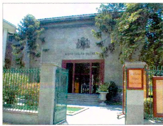
Fachada Museo Benjamín Vicuña Mackenna