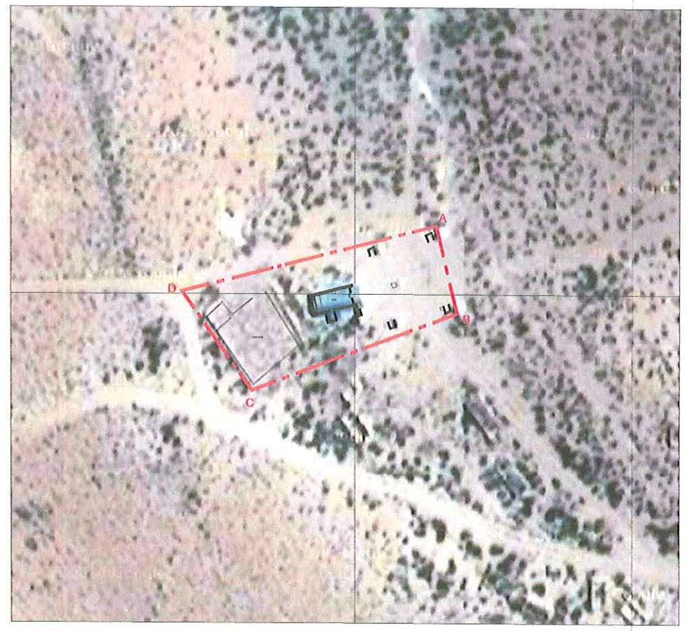
PLANO DE UBICACIÓN ESCALA GRÁFICA

NOTAS: Plano elaborado en el Consejo de Monumentos Nacionales en base a: • Levantamiento Arquitectónico y levantamiento GPS Datum WGS 84, Huso 19 S, mes febrero de 2015. Realizado por Fundación Altiplano Monseñor Salas Valdés. • Base de información: Estudio Diagnóstico de Declaratoria MN Iglesia San Santiago Apóstol de Airo, profesionales a cargo: Cristián Heinsen, Ronald Calcedo, Marta Plech, Claudio Bulín y Alejandra Palacios.