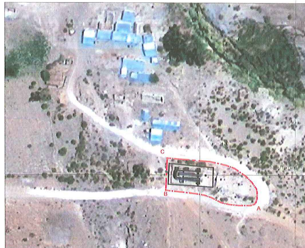
PLANO DE UBICACIÓN ESCALA GRÁFICA

NOTAS: Plano elaborado en el Consejo de Monumentos Nacionales en base a: • Levantamiento Arquitectónico y levantamiento GPS Datum WGS 84, Huso 19 S, mes febrero de 2015. Realizado por Fundación Altiplano Monseñor Salas Valdés. • Base de información: Estudio Diagnóstico de Declaratoria MN Iglesia San Antonio de Padua de Sucuna, profesionales a cargo: Cristián Heinsen, Ronald Caicedo, Marta Piech, Claudio Bulín y Alejandra Palacios.