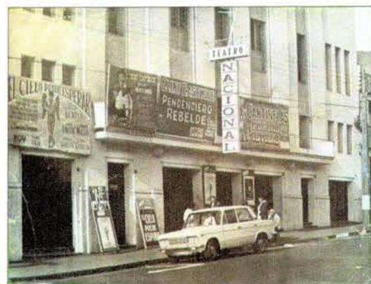
Fotografía histórica de fachada principal