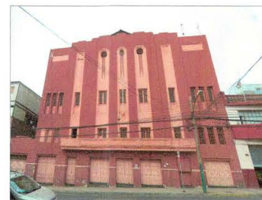
Vista Fachada principal