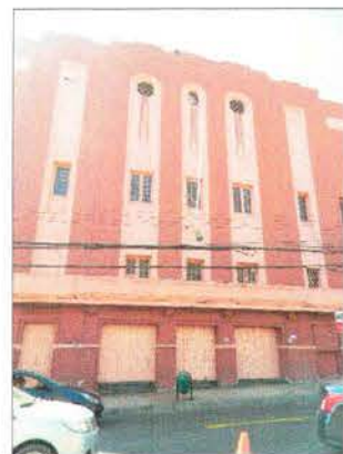
Vista Fachada principal