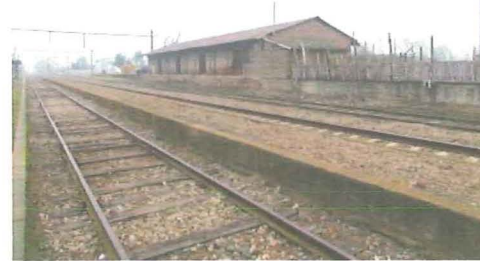
Vista Andenes y Bodega