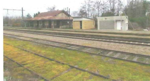
Vista Estación de Villa Alegre