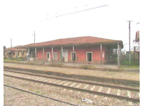
Estación de Teno