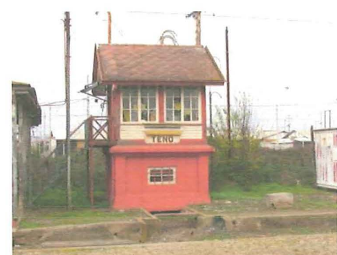
Cabina de movilización en desuso