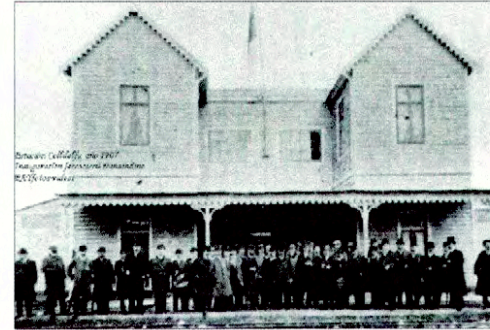
Imagen Histórica de la Estación de Collilelfu