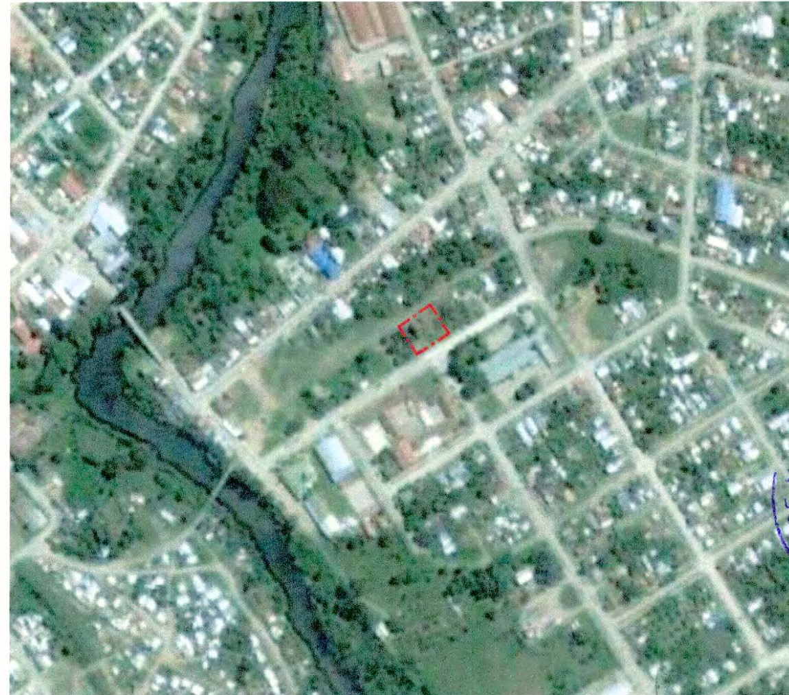
PLANO DE UBICACIÓN EN BASE A FOTO GOOGLE EARTH SIN ESCALA