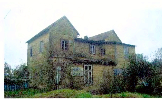
Vista sur de la Estación de Collilelfu