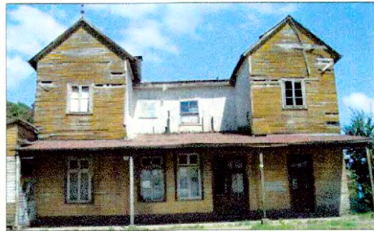
Vista actual de la Estación de Collilelfu