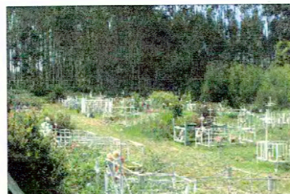
Vista nororiente del Cementerio Los Huape