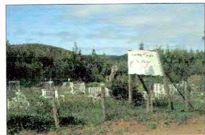
Cementerio Los Huape