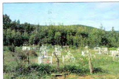
Vista oriente del Cementerio Los Huape