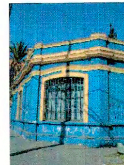
Ochavo Fachada Av. Ossa y Av. Gran Avenida José Miguel Carrera