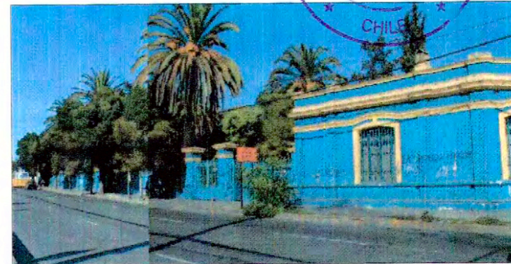
Fachada a Av. Gran Avenida José Miguel Carrera