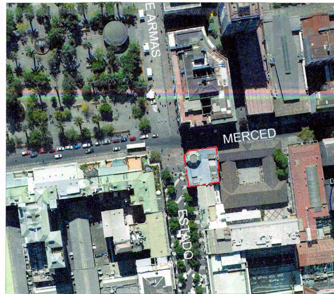
PLANO DE UBICACIÓN SIN ESCALA