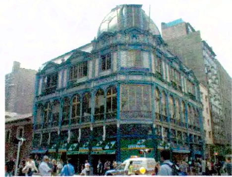
Vista Fachada Principal de Edificio Comercial Edwards