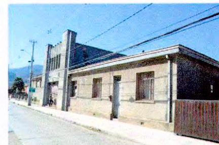
Vista desde Av. Los Cerezos