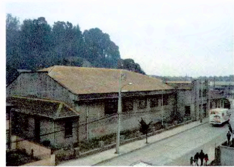
Vista volumen principal