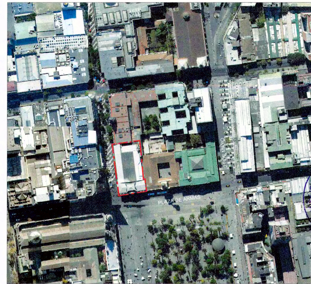
PLANO DE UBICACIÓN SIN ESCALA