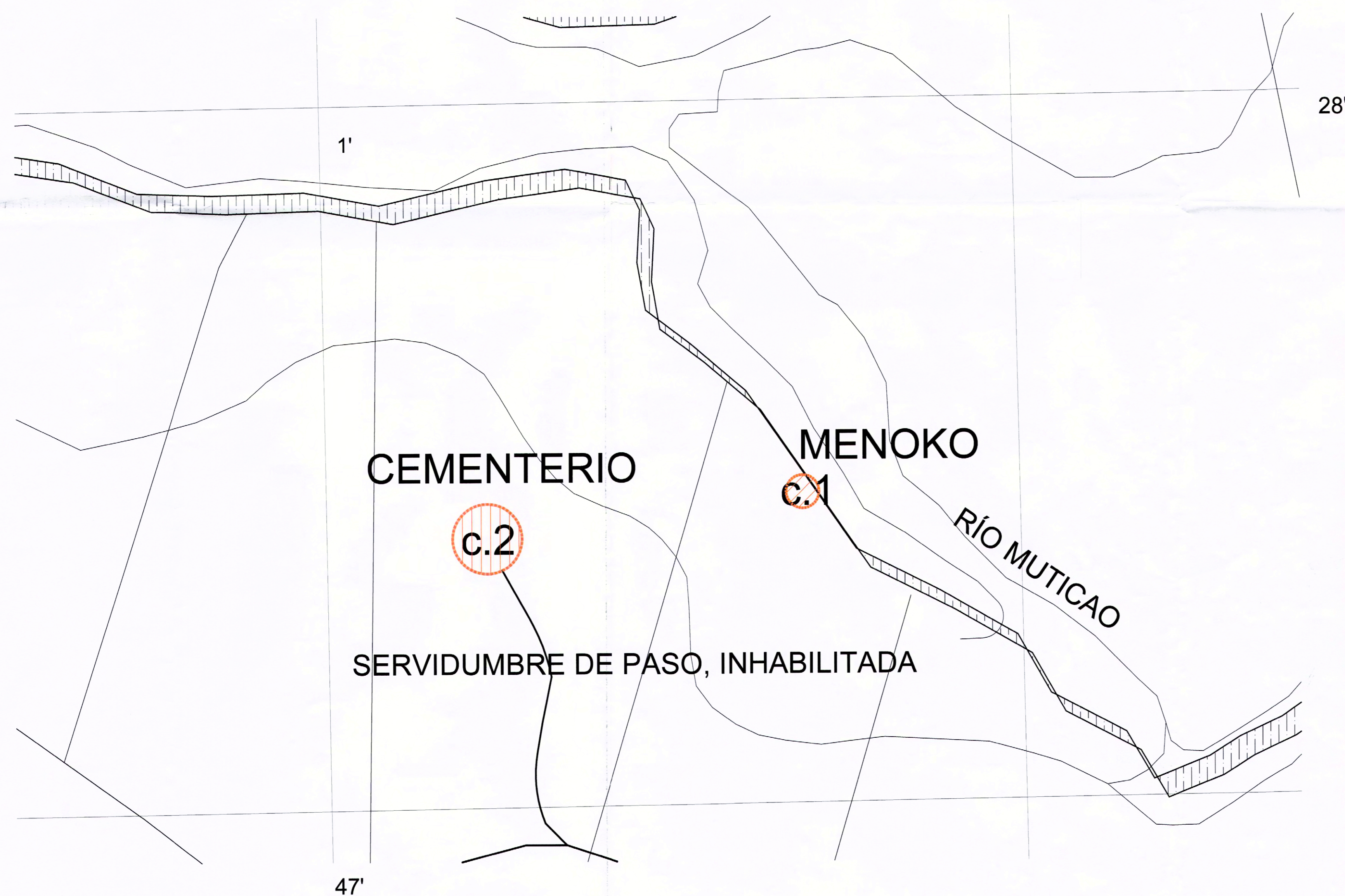
ACERCAMIENTO ELTUWE (CEMENTERIO) Y MENOKO