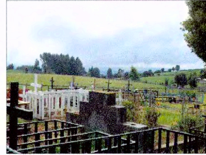
Fotografía N° 4 - Digital octubre 2012 Vista desde el cementerio nuevo hacia el noreste