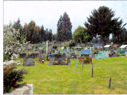
Fotografía N° 3 - Digital octubre 2012 Vista desde el poninte del cementerio nuevo hacia el oriente