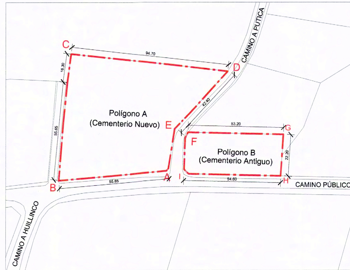
PLANO DE LÍMITES ESCALA GRÁFICA