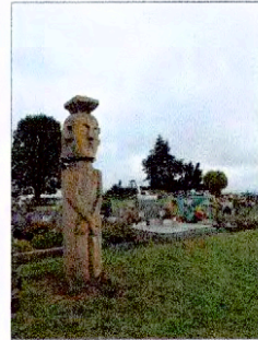
Fotografía N° 2 Digital octubre 2012 Chemamüll en cementerio nuevo