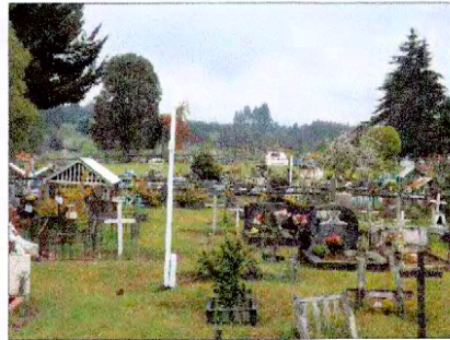
Fotografía N° 1 - Digital octubre 2012 Vista desde el poninte del cementerio antiguo hacia el oriente.