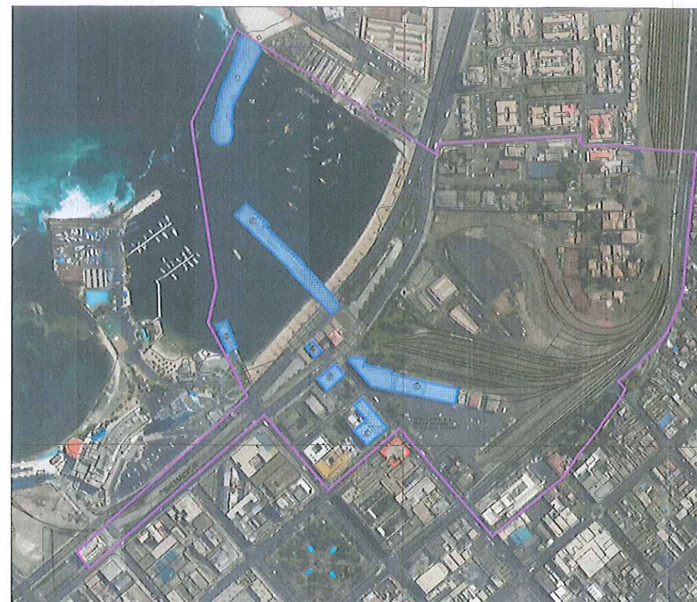
PLANO DE UBICACIÓN ESCALA GRÁFICA