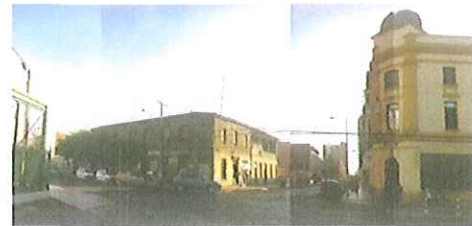
Vistas a las Casas Dauelsberg y Cable West Coast