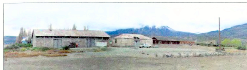
Vista general bodegas portuarias y muelle antiguo de Puerto Ibañez.