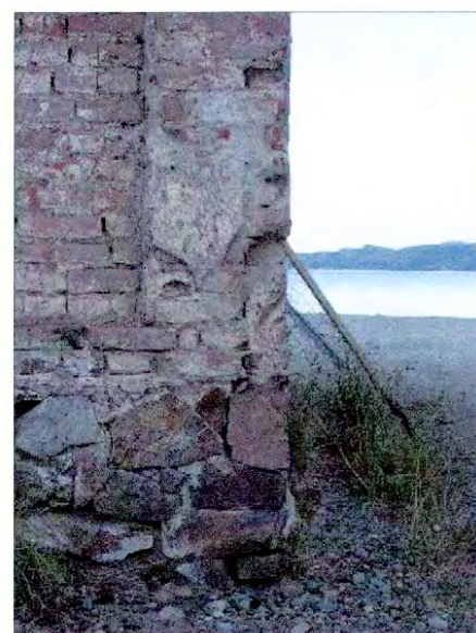
Detalle funciones y estructura albañilería bodega portuaria (año 1930).