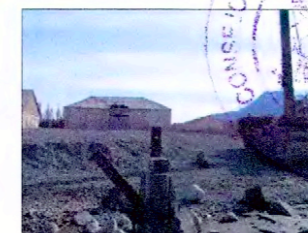
Vista bodega antigua (año 1930) desde muelle antiguo y pluma de carga.

NOTA: Fotografías provenientes de Ficha del Inmueble y Plano elaborado en el Consejo de Monumentos Nacionales en base a: -Antecedentes aportados por el Ministerio de Obras Públicas, Dirección de Arquitectura, Región de Aisén del General Carlos Ibáñez del Campo, mayo de 2008.