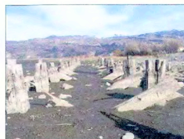
Estado actual muelle antiguo por embaucamiento del lago.