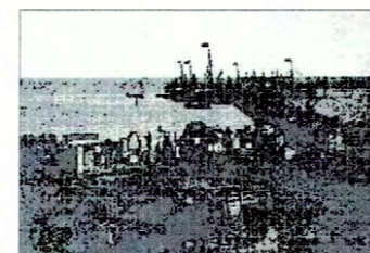
Vista muelle antiguo, contiguo a las bodegas.