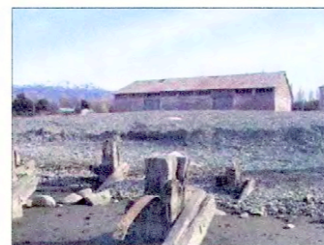
Vista bodega portuaria (año 1961).