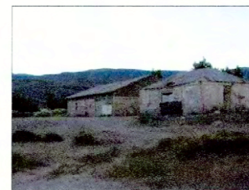
Vista bodegas portuarias.