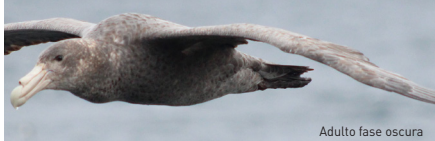
Adulto fase oscura