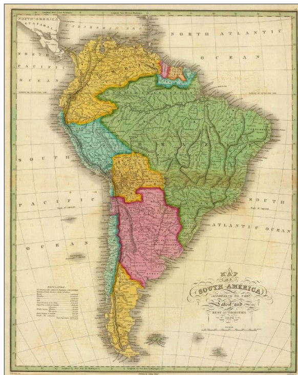
Mapa de América latina en 1826.