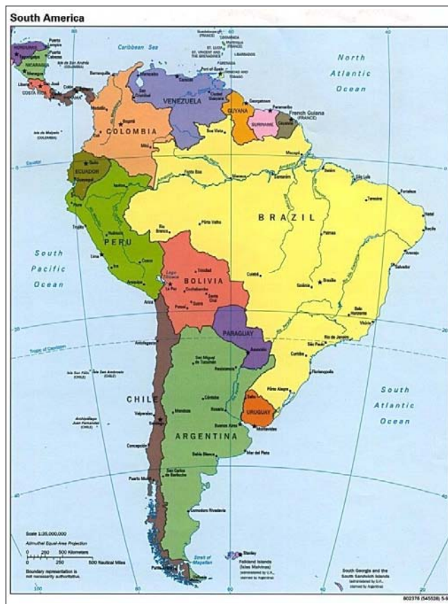
Mapa de América Latina 1995.