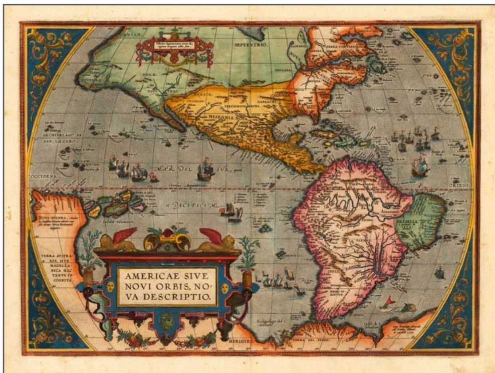
Mapa de 1595

Ahora, observa los siguientes mapas y responde las preguntas a continuación. 5