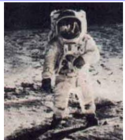
En la Luna, pesa seis veces menos.

Lo que ocurre es que la costumbre nos ha hecho trabajar desde chicos solo con el concepto de peso , el cual hemos asociado siempre al kilogramo , y nos han habituado a usarlo, sin saberlo nosotros, como sinónimo de masa . Por eso, cuando subimos a una balanza decimos que nos estamos " pesando ", cuando en realidad estamos midiendo nuestra cantidad de masa , que se expresa en kilogramos .