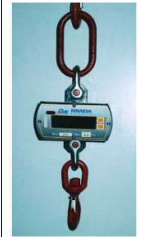
Un tipo de dinamómetro.

Lo que hacemos es usar nuestra medición de MASA como si fuera nuestro "PESO" y al bajar de la balanza decimos "PESÉ 70 KILOS" si la máquina marca esa cantidad, pero el PESO REAL SERÁ 686 Newtons (N) (70 por 9,8 es igual a 686).