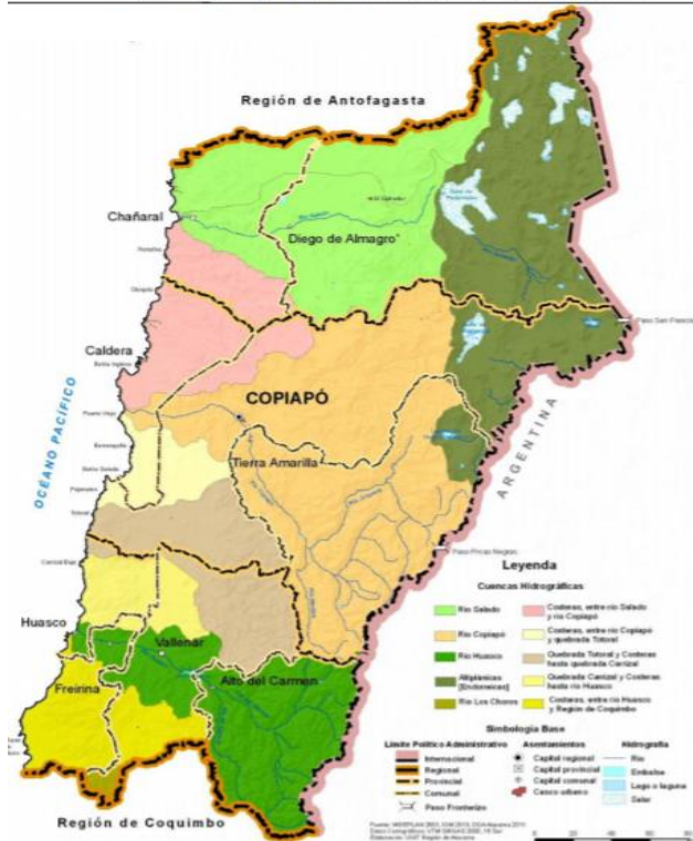
MAPA CON LAS PRINCIPALES CUENCAS DE LA REGIÓN DE ATACAMA