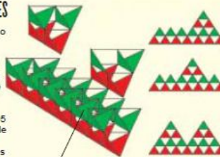
La cometa tetraédrica, cuya forma de cuatro caras triangulares demostraría ser ligera, fuerte y rígida

También creó el fotófono (un aparato para transmitir sonidos por medio de rayos de luz), el audiómetro (medidor de la agudeza del oído) y el primer cilindro de cera para grabar sonidos. A partir de 1895 investigó en el campo de la aeronáutica con la construcción de grandes cometas y en el año 1907 ideó una que podía transportar a una persona.