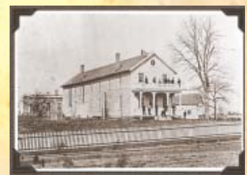
Fachada de la fábrica de Menlo Park

En este lugar, Edison se dedicó a trabajar en sus inventos (el transmisor de carbono para la mejora del teléfono, el fonógrafo para grabar el sonido); y luego creó un gran laboratorio de experimentación e investigación en West Orange.