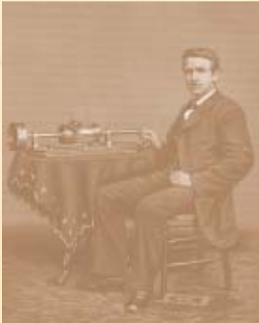
En 1877 crea el fonógrafo

Monta un laboratorio en Menlo Park (New Jersey), un año después inventa el fonógrafo y en 1878 le nombran caballero de la Legión de Honor Francesa. El 21 de octubre de 1879 su bombilla luce varias horas seguidas y el día de Nochevieja ilumina la calle principal de Menlo Park.