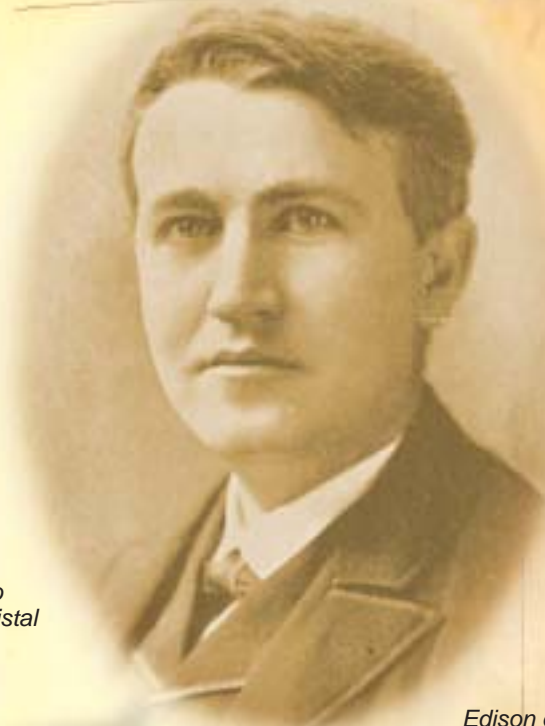
Edison en un grabado del año 1896