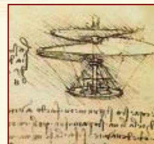
Una máquina voladora. ¿El primer helicóptero?