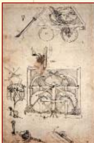
Plano original del 'automóvil' creado por Leonardo