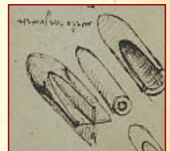
Proyectiles con formas muy adelantadas para la época