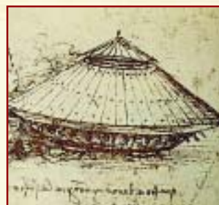
El auto acorazado de Da Vinci, según su diseño