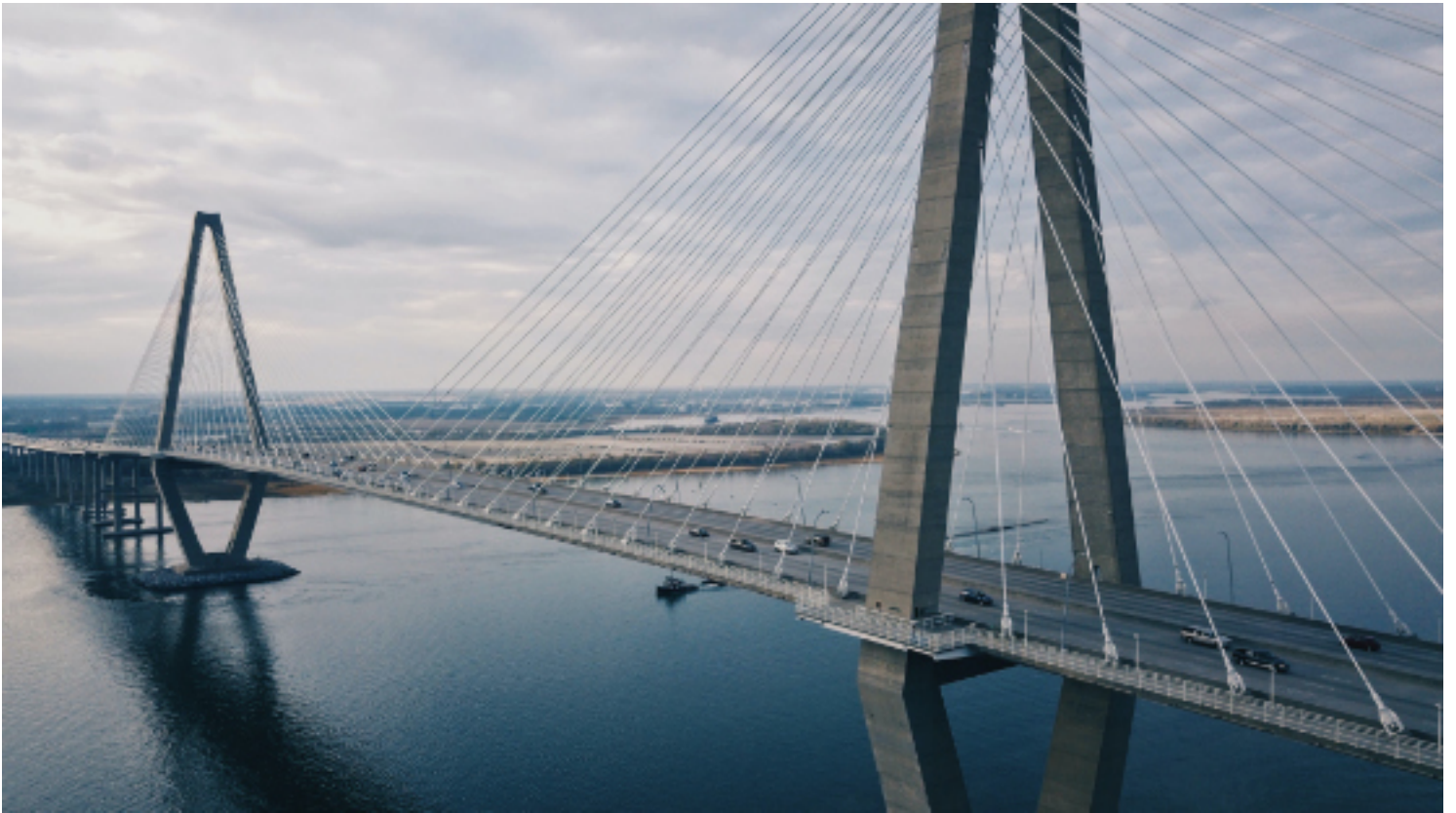
PUENTE CON TIRANTES