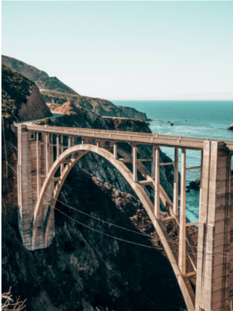
PUENTE DE ARCO