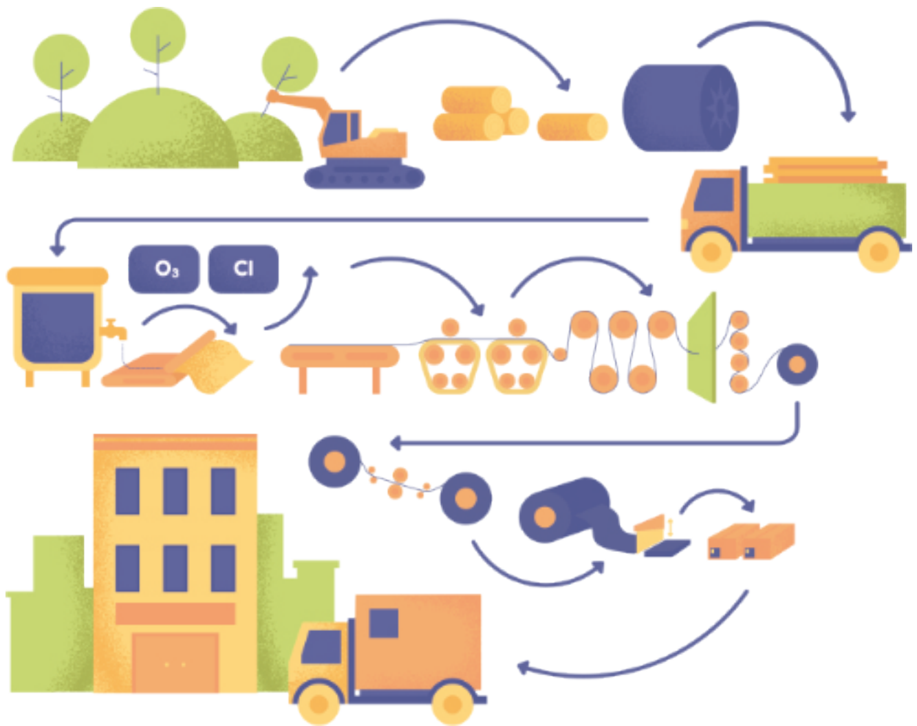
FÁBRICA DE PAPEL