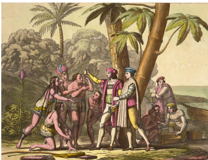
Litografía coloreada a mano, aprox. 1860-1880.

El 11 de octubre el viento fue fuerte y la velocidad grande. Los indicios de tierra se multiplicaban: una rama verde, una tabla, un pequeño bastón labrado. Los hombres no estaban lejos. Por la noche hubo luna pura y clara, que lo iluminaba todo delante de los barcos. El miedo a las rocas tensaba los nervios.