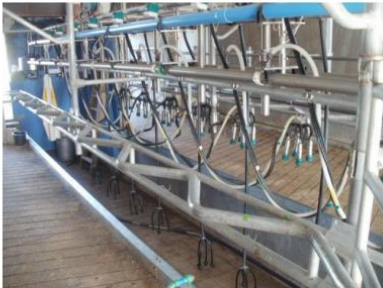
Equipo de ordeño.