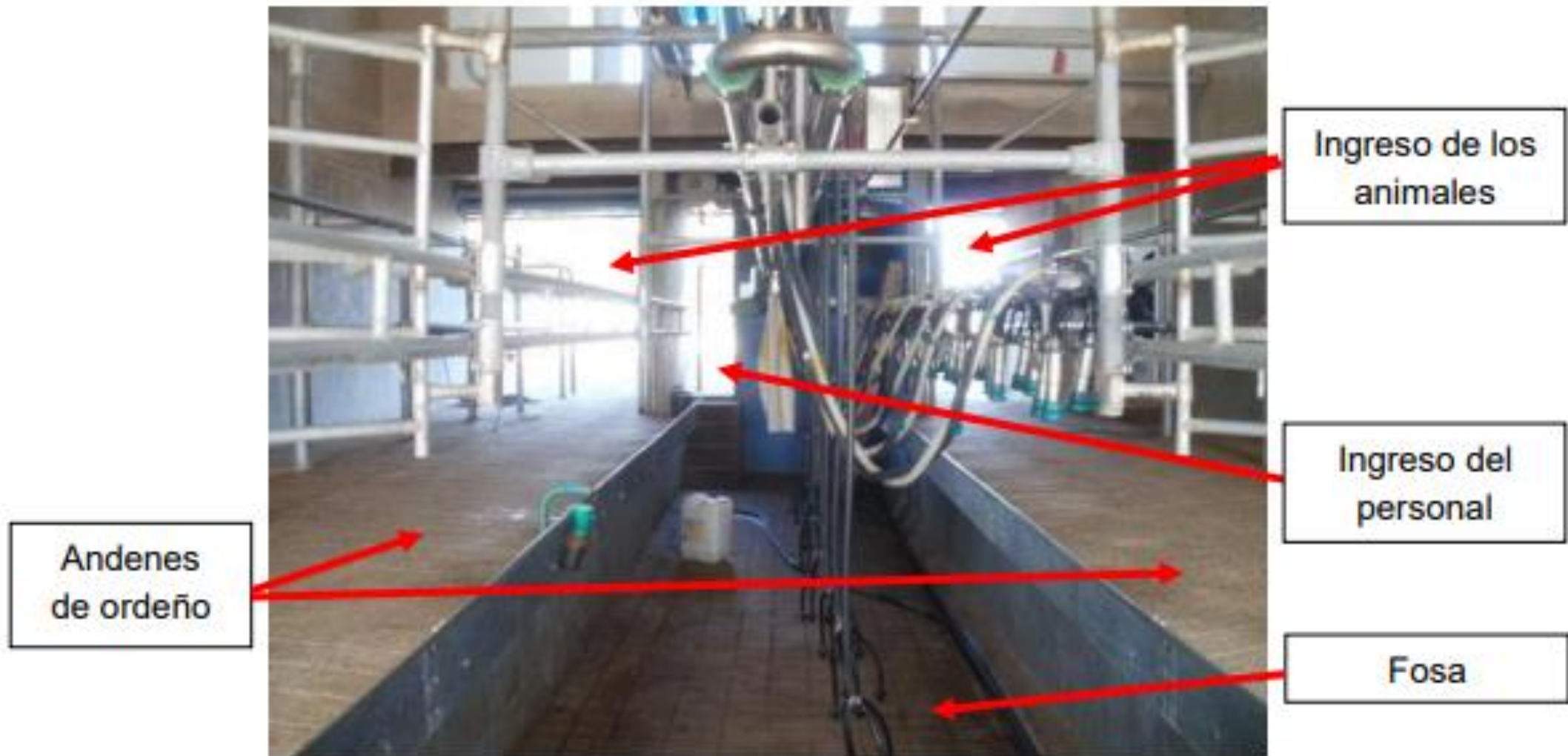
Sala de ordeño (ingreso de los animales y del personal).