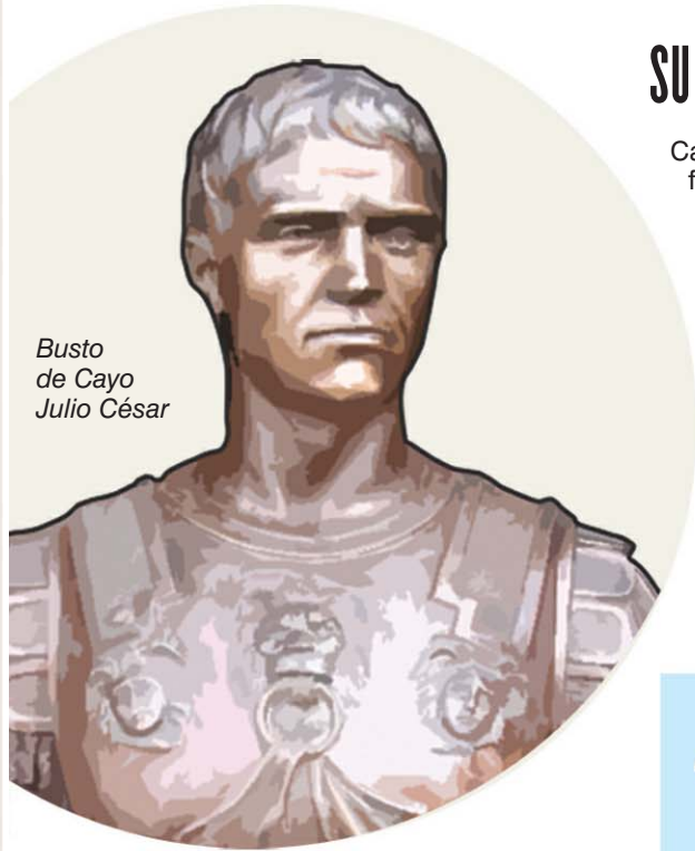
Busto de Cayo Julio César

Durante el final de la República romana, este dictador, general e historiador destacó como una de las principales personalidades dentro del ámbito político y militar. Bajo su mando se conquistaron los territorios de la Galia (campana sobre la que escribió un libro), se intervino en la situación de Egipto (donde conoció a Cleopatra) y se llevaron a cabo ciertas reformas que estabilizaron todo el mundo mediterráneo.